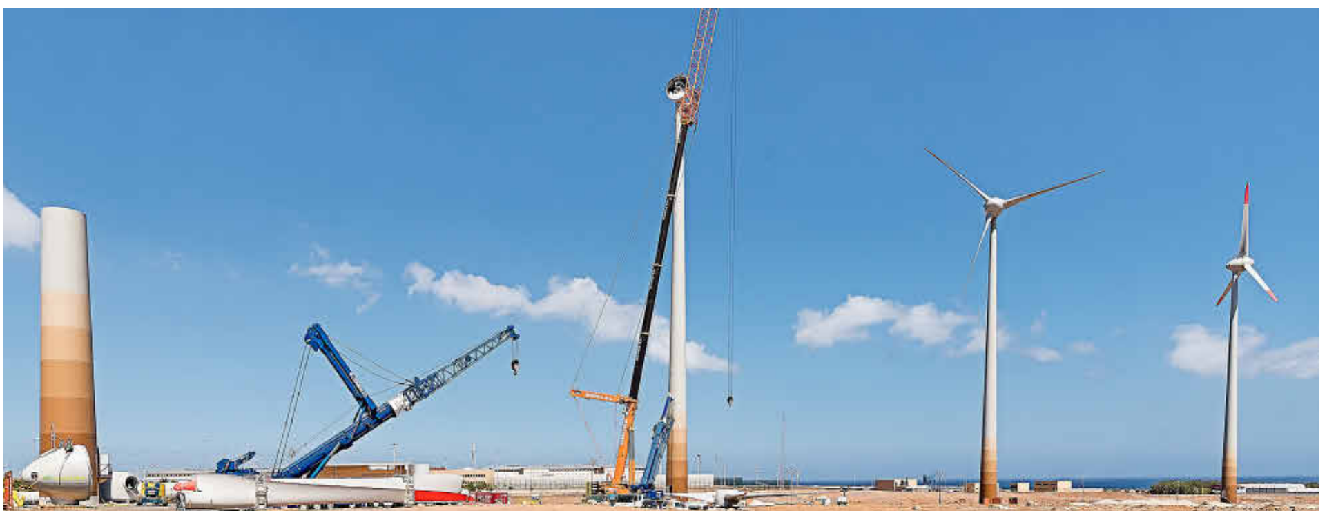
Parque en construcción en San Bartolomé de Tirajana, propiedad de Ecoener

Más de 15 años trabajando y apostando por la economía local.