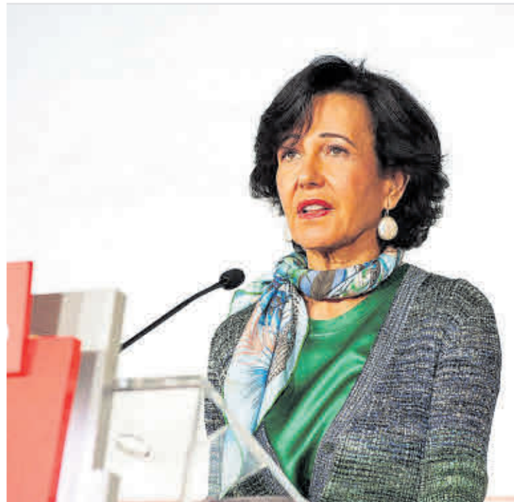
Ana Botín, ayer, en la presentación de los resultados de la entidad en 2020 en Madrid.

El grupo, así, confirmó su intención de abonar 0,0275 euros por acción en efectivo con cargo al resultado ordinario del 2020, "la cantidad máxima permitida" por el Banco Central Europeo (el 15% del beneficio recurrente). También aseguró que recuperará su política de distribuir entre el 40%