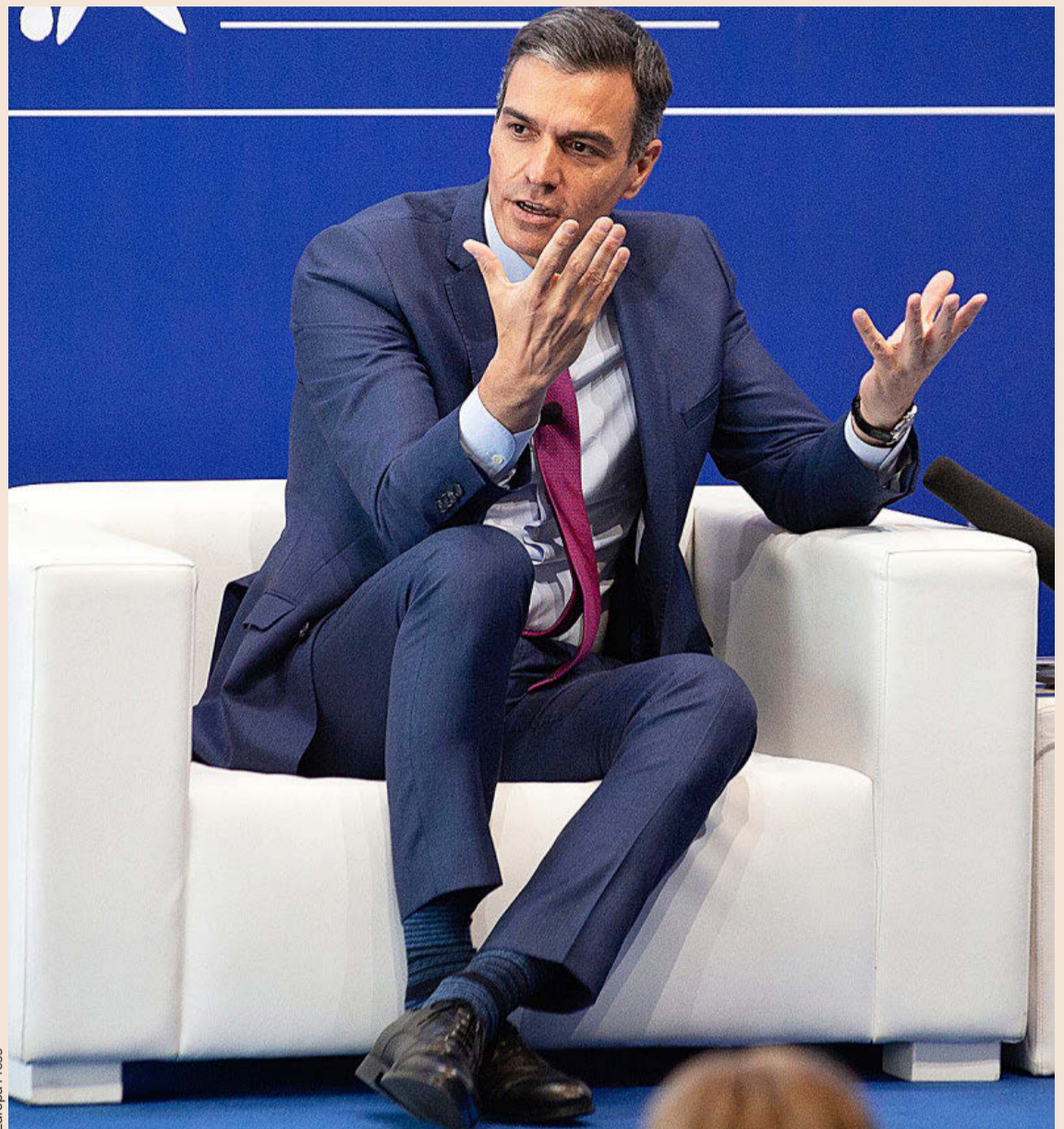
Pedro Sánchez, el viernes pasado durante su intervención en la reunión anual del Círculo de Economía, en Barcelona.

El acto del Liceo es presidencialista al estilo de los town hall meetings de Norteamérica que tanto gustan a los asesores mediáticos de Moncloa. Si por ellos fuese, el discurso del presidente del Gobierno admitiría comparaciones con el que pronunció Abraham Lincoln en el campo de Gettysburg. Y esto, claramente, es un disparate. Lincoln habló en 1863 en la ceremonia que inauguraba un cementerio para los caídos en el lugar donde meses antes se había producido la batalla más sangrienta y decisiva de la Guerra Civil americana. Ganaron los suyos, los unionistas de la república federal, y Lincoln declaró que la nación, bajo Dios, nacería de nuevo en libertad y que "el gobierno del pueblo, por el pueblo y para el pueblo no perecerá en la tierra". La