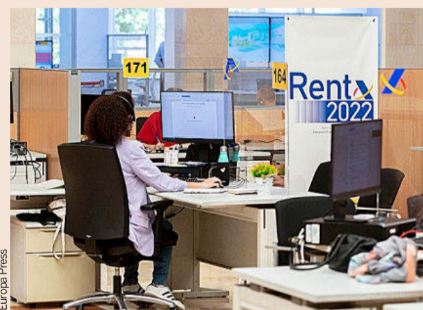
Oficina de la Agencia Tributaria.

en los que el intermediario fiscal ponga de manifiesto su condición de persona adherida al Código de Buenas Prácticas de Profesionales Tributarios, así como su voluntad de agilizar la tramitación del procedimiento y reducir la litigiosidad, a facilitarle, lo antes posible, el conocimiento de los hechos susceptibles de regularización. Asimismo, y siempre que las circunstancias lo justifiquen, el documento se compromete a facilitar la celebración de reuniones tendentes a poner de manifiesto y aclarar cuestiones de relevancia que se hubieran